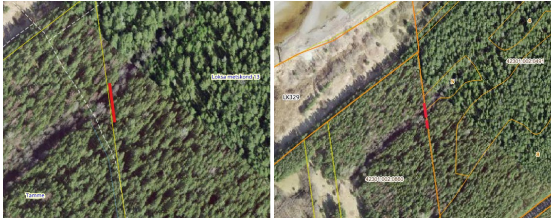
Joonis 1. Uuendatava tee lõik e-mailis (vasakul), uuendatava tee lõik lähteülesandes (paremal).

kus kehtib looduskaitseseadusega (LKS) ja Lahemaa rahvusparki kaitse-eeskirjaga 2 (edaspidi kaitse-eeskiri ) sätestatud kaitsekord. Lahemaa rahvusparki kaitse-eesmärk on kaitsta Põhja-Eestile iseloomulikke loodust ja kultuuripärandit. Lisaks kuulub Lahemaa rahvuspark Lahemaa linnu- ja loodusala üleeuroopalise kaitsealade võrgustiku Natura 2000 koosseisu. Kaitse-eesmärgiks olevad elupaigatüübid ja liigid on toodud kaitse-eeskirja § 1 lg 1 p-des 2–6.